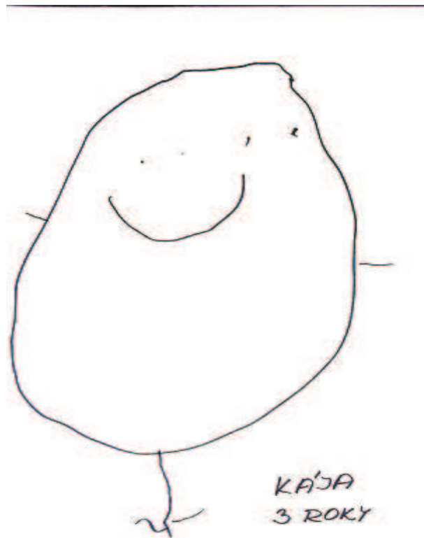
Kresba postavy 3letého dítěte

Až kolem 6. roku je tělo postavy úplné a se všemi končetinami.