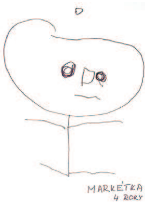
Kresba postavy 4letého dítěte