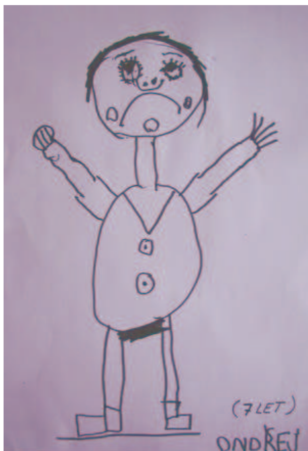
Kresba postavy 7letého dítěte