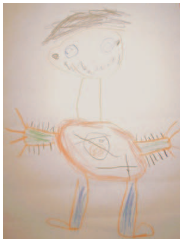
Kresba postavy 5letého dítěte