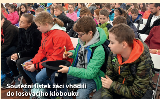
Soutěžní lístek žáci vhodili do losovacího klobouku